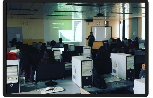
ZARARLI YAZILIM VE KRİPTOLOJİ EĞİTİMİ

4 ARALIK 2017 TARİHİNDE GERÇEKLEŞEN CUMHURİYET ÜNİVERSİTESİ SİBER GÜVENLİK KONFERANSI