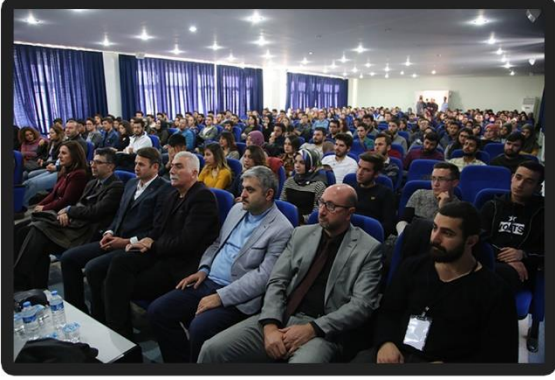
SİBER GÜVENLİK KONFERANSI

4 ARALIK 2017 TARİHİNDE GERÇEKLEŞEN CUMHURİYET ÜNİVERSİTESİ SİBER GÜVENLİK KONFERANSI